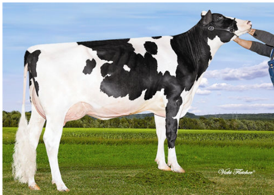
BLONDIN MAN O MAN ARKANSAS Dam